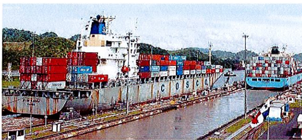
Raggiunto un accordo per concludere i lavori dell'ampliamento del Canale di Panama entro il 2015

MILANO È stato raggiunto l'accordo con l'Autorità locale per concludere i lavori dell'ampliamento del Canale di Panama. Salini Impregio assume di fatto il ruolo di capofila morale di Grupo Unidos por el Canal (Gupc), il consorzio di grandi imprese di costruzione internazionali composto oltre che dal gruppo italiano da Sacyr e Jan de Nul. L'accordo spiega una nota - prevede il completamento del progetto nel dicembre 2015; il trasporto e la consegna dei Gates dall'Italia a Panama entro il dicembre 2014; il finanziamento di completamento per 400 milioni di dollari.