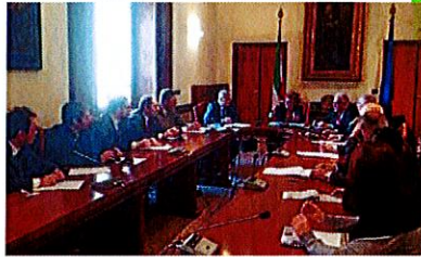
Una fase dell'incontro organizzato nella sede della prefettura di Brescia